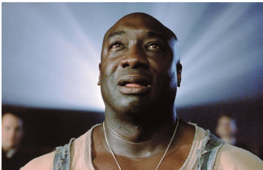
Michael Clarke Duncan 10 december 1957 - 3 september 2012